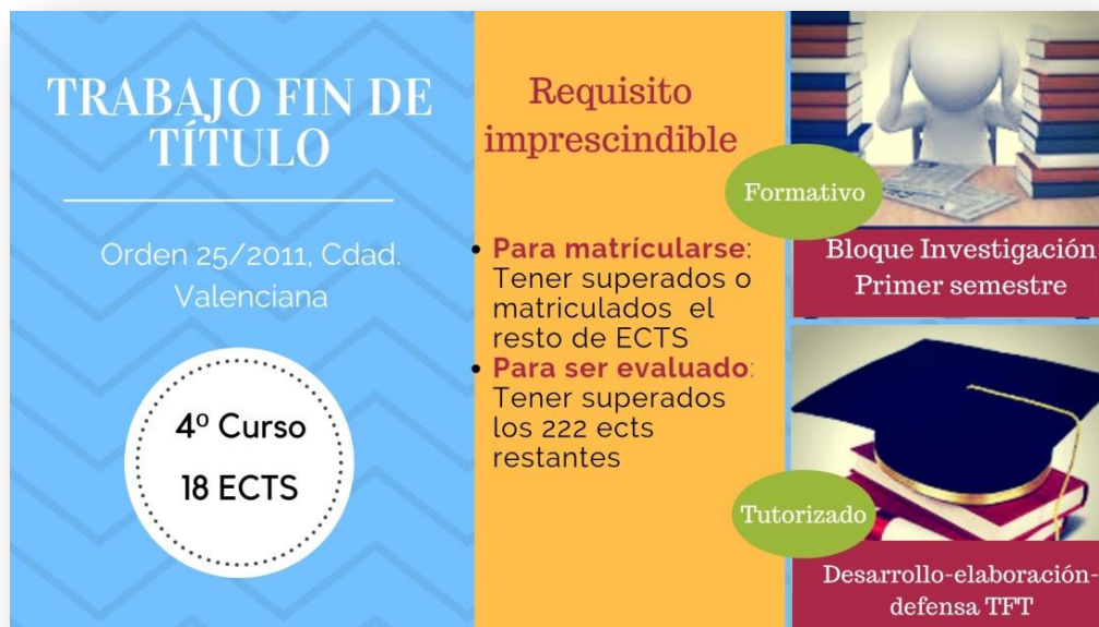
Figura 1. Resumen informativo sobre TFT.

Atendiendo a la orden 85/2014 de 23 de octubre, de la Conselleria de Educación, Cultura y Deporte, por la que se regulan las asignaturas optativas, el trabajo de fin de título y las prácticas académicas externas de los estudiantes de enseñanzas artísticas superiores de los centros del Instituto Superior de Enseñanzas Artísticas de la Comunitat Valenciana: “Para matricularse del TFT será necesario tener matriculadas todas las asignaturas requeridas para finalizar el plan de estudios” (art 11.6), y además “el TFT será evaluado una vez que el estudiante disponga de todos los créditos necesarios para la obtención del título correspondiente, salvo los correspondientes al propio TFT” (art. 9.7).