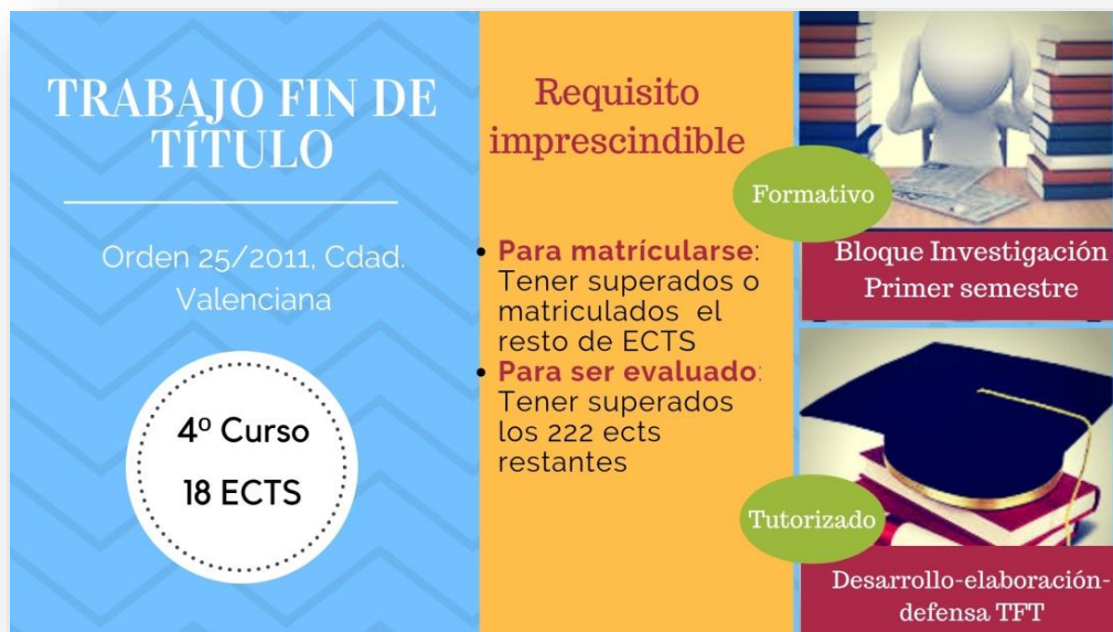
Figura 1. Resumen informativo sobre TFT.

Atendiendo a la orden 85/2014 de 23 de octubre, de la Conselleria de Educación, Cultura y Deporte, por la que se regulan las asignaturas optativas, el trabajo de fin de título y las prácticas académicas externas de los estudiantes de enseñanzas artísticas superiores de los centros del Instituto Superior de Enseñanzas Artísticas de la Comunitat Valenciana: “Para matricularse del TFT será necesario tener matriculadas todas las asignaturas requeridas para finalizar el plan de estudios” (art 11.6), y además “el TFT será evaluado una vez que el estudiante disponga de todos los créditos necesarios para la obtención del título correspondiente, salvo los correspondientes al propio TFT” (art. 9.7).